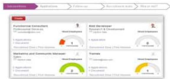
Gambar 4. Membuat job position