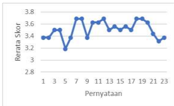
Tabel 2. Respon Mahasiswa Perkuliahan TA 2018/2019

Tabel 2 di atas menunjukkan bahwa pernyataan nomer 5, terkait kemampuan menghidupkan kelas, juga memiliki skor terendah yaitu 3,19 seperti tahun sebelumnya meskipun menunjukkan peningkatan. Untuk tahun 2018, skor rerata nomer tertinggi adalah 3,69 untuk pernyataan nomer 7, 8, 12, 18, dan 19. Skor-skor tersebut terkait dengan pernyataan yang berhubungan dengan memberi kesempatan mahasiswa untuk bertanya/mengemukakan pendapat, menjawab pertanyaan mahasiswa di kelas, perlakuan dosen kepada semua mahasiswa sama, tugas yang diberikan mendukung materi kuliah, dan memberikan kesempatan pada mahasiswa untuk bertanya di luar kelas.