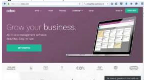
Gambar 1. Halaman laman ODOO

kelas HRIS yang terdiri 10 orang laki-laki dan 39 orang perempuan. Pelaksanaan uji usability dilakukan di laboratorium komputer dengan teknik pengumpulan data melalui kuesioner untuk mengukur learnability , flexibility , effectiveness dan attitude (Yacob et al., 2016). Hasil penelitian menunjukkan bahwa nilai total usability aplikasi ODOO mencapai 79,15%. Nilai tersebut diperoleh dari aspek learnability = 79,93%, flexibility = 73,46%, effectiveness = 77,55%, attitude = 80,61%. Penggunaan aplikasi ODOO dapat dijelaskan dalam gambar berikut (Fahmie, Miranty, Agustina, & , 2018) :