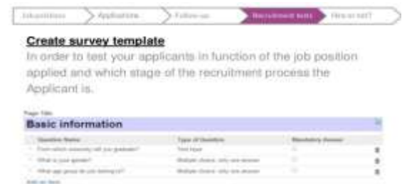
Gambar 7. Pengumpulan data saat seleksi