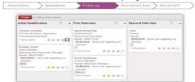
Gambar 6. Tindak lanjut lamaran yang masuk