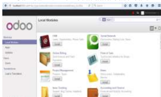
Gambar 3. Pilihan modul