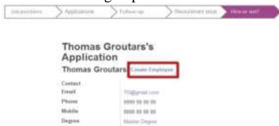
Gambar 8. Pengambilan keputusan seleksi