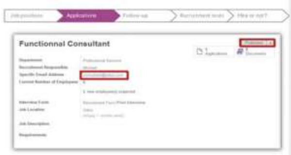
Gambar 5. Contoh salah satu job position