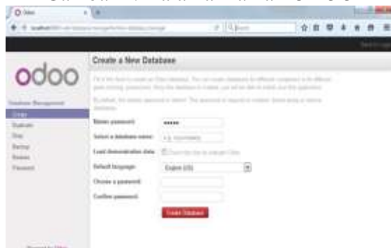
Gambar 2. Membuat data base baru